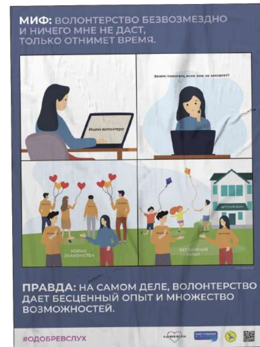
Плакаты. Формат: А4, А3, А2.