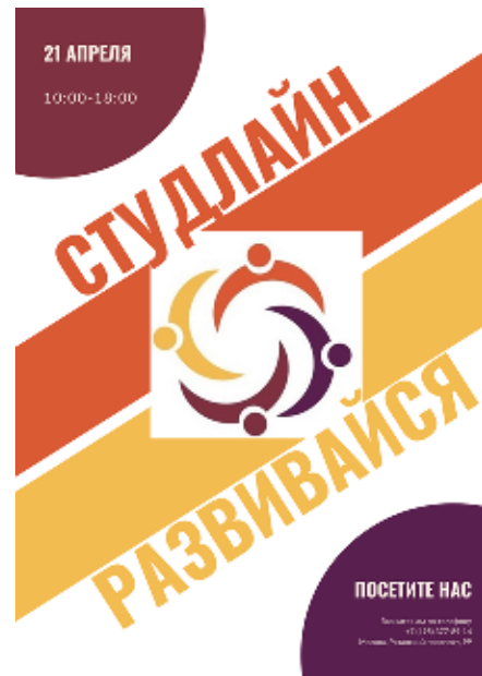
Плакат с анонсом фестиваля